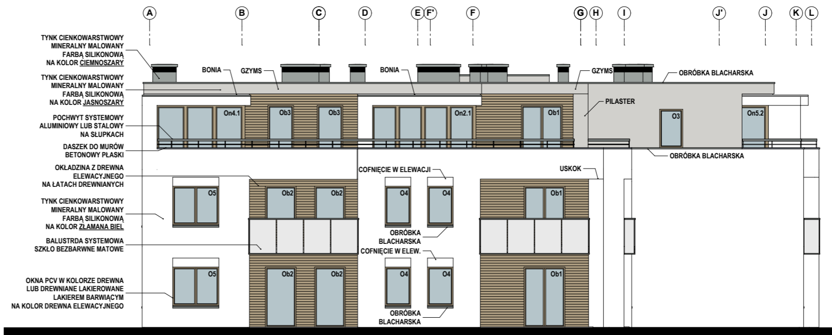
BUDYNEK NR 1 ELEWACJA ZACHODNIA

PRACOWNIA PROJEKTOWA architekt GRAŻYNA STOJEK SIEDZIBA : 71-220 Szczecin, ul. Inspektowa 5 tel. 601 888 232