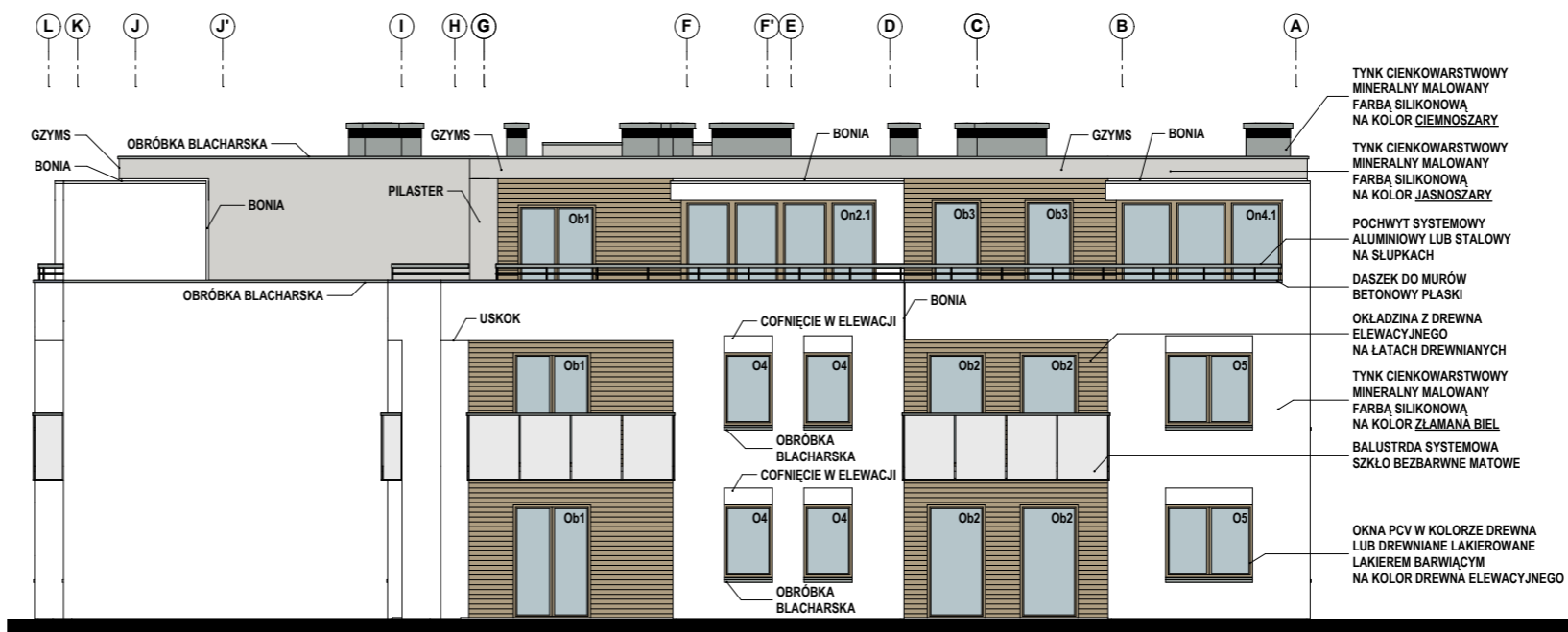
BUDYNEK NR 1 ELEWACJA WSCHODNIA